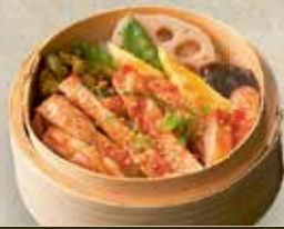
Tori Teriyaki Cey-Ro 10,20 € gegrilltes Hühnerfleisch