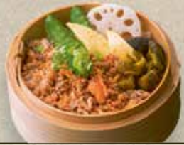
Sake Soboro Cey-Ro 7,50 € gegrillter und fein gehackter Lachs