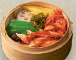
Harasu Kimuchi Cey-Ro 9,50 € gegrillter Lachs und auf koreanische Art scharf eingelegter Chinakohl 12