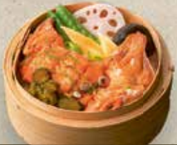
Sake Kama Cey-Ro 8,20 € gegrillter Lachsschulter