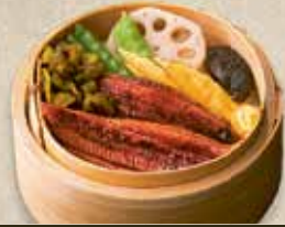
Unagi Cey-Ro 17,60 € gegrillter Aal 2,12