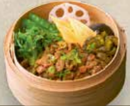
Asari Cey-Ro 8,20 € kleine gekochte Venusmuscheln (scharf) mit eingelegtem Seegras 2,8,12