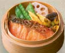
Sake Teriyaki Cey-Ro 9,80 € in Teriyaki-Soße eingelegter und gegrillter Lachs